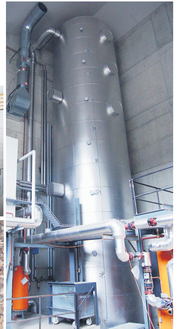
Eine «Schnecke» (unten) transportiert Schnitzel (möglich sind auch Holzabfälle) in den Brenner mit Filter (oben); in einem späteren Schritt kann die Anlage um einen doppelt so grossen Brenner erweitert werden. Der Speicher ist ein 100 000-Liter-Tank (rechts). Die Abwärme im Heizungsraum wird durch das Rohr (rechts, oben) in die Einstellhalle geblasen.