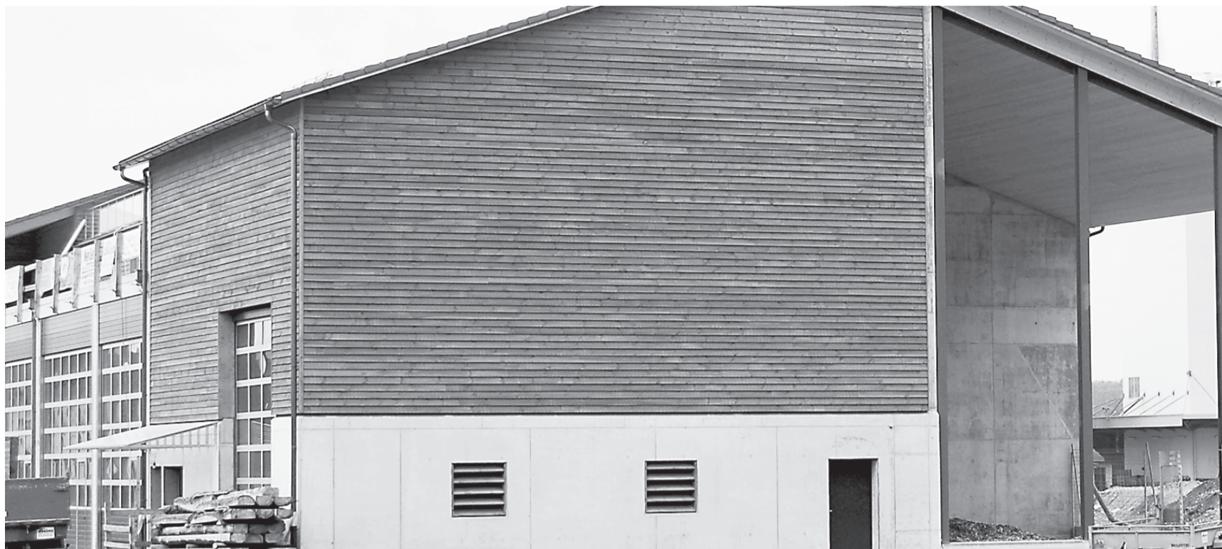
Zuerst wurde die Fernwärmezentrale gebaut, die unter anderem auch das Feuerwehrgebäude heizt.

Der Bauherrschaft war die Frage der Ökologie ein wichtiges Anliegen, weshalb ein Holzbau privilegiert wurde. Leider verlangten feuerpolizeiliche Auflagen einige Kompromisse. So wurde neben dem Untergeschoss, das deutlich ins Grundwasser reicht, auch im oberirdischen Teil zur Trennung der Brandabschnitte Eisenbeton verwendet. Dachstock, Aussenhülle sowie alle Büro- und Wohnräume sind komplett aus Holz, welches hauptsächlich in der Region gewachsen ist.