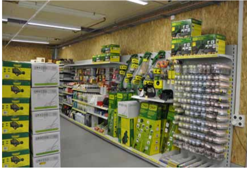
Viele Artikel zur Rasenpflege.

Architekturbüro HP. Keller, Oberstammheim