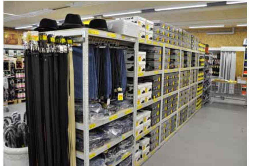
Arbeitskleidung und Schuhwerk für draussen.