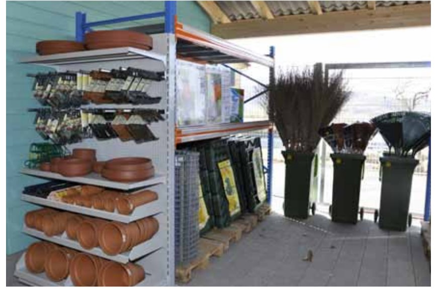
Alles rund um die Pflanze.