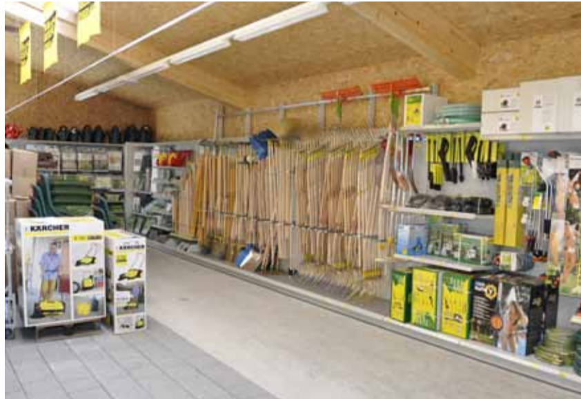
Ein Blick in die Gartenabteilung.