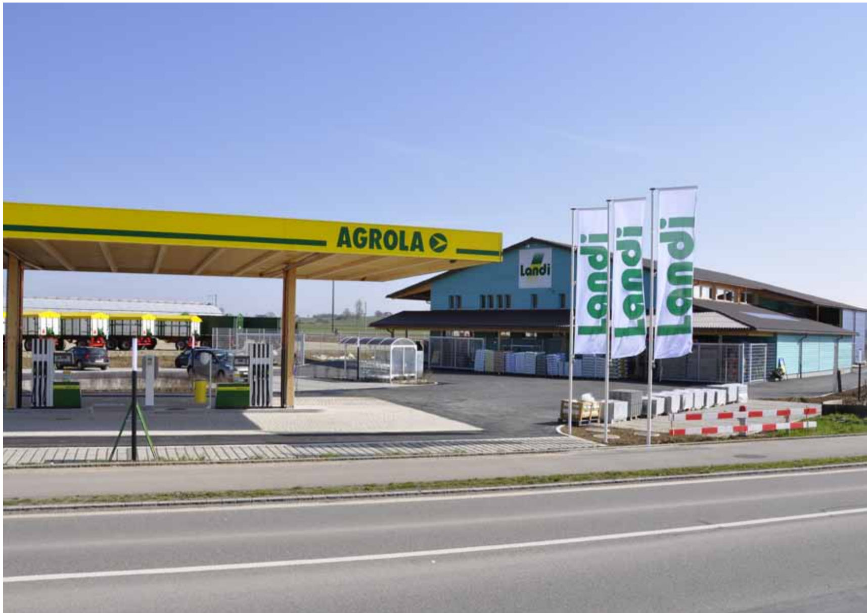
Die neue Landi im Stammertal mit der Agrola Tankstelle.